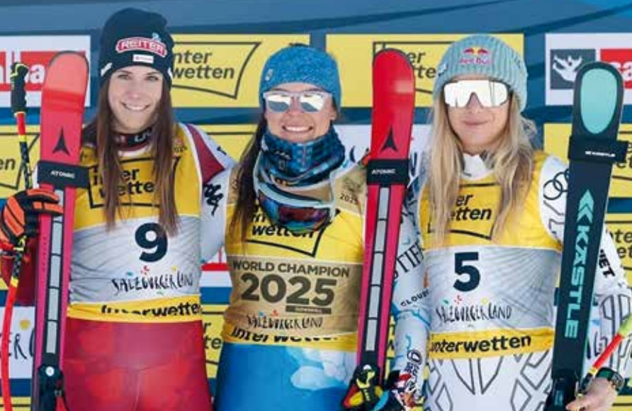
Pódium! Zleva stříbrná Mirjam Puchnerová, vítězná Breezy Johnsonová a bronzová Ester Ledecká.

saalbach 2025 SALZBURGERLAND FIS ALPINE WORLD SKI CHAMPIONSHIPS