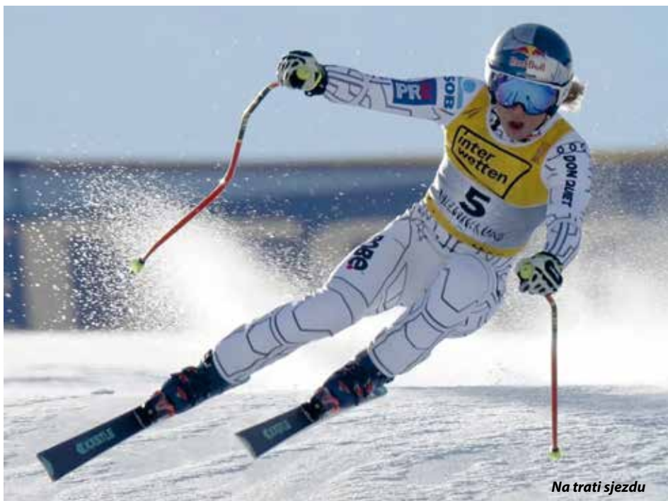
Na trati sjezdu