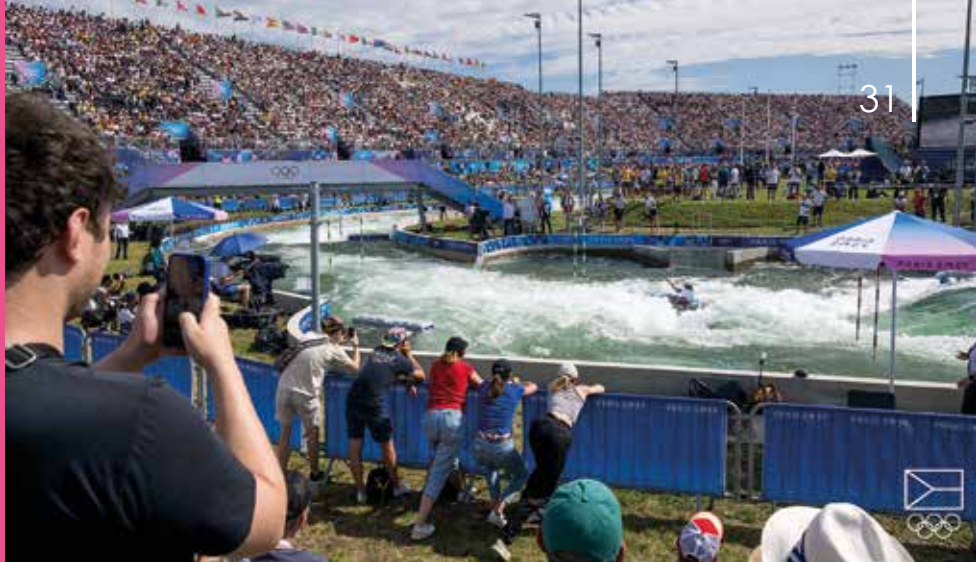
Slalomářský areál ve Vaires-sur-Marne