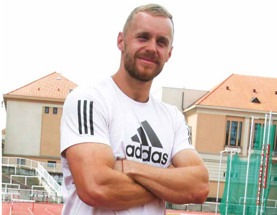
Oštěpař Jakub Vadlejch může být s výkony v letošní sezoně náramně spokojený.

Získal třetí diamantovou trofej, v sezoně vyhrál devět závodů z dvanácti. Oštěpař Jakub Vadlejch může být na své výkony právem hrdý. A je tu ještě další pozitivum. Po srpnovém bronzu z mistrovství světa v Budapešti dokázal svého největšího rivala Níradže Čopru z Indie dvakrát porazit, což je z psychologického hlediska před olympijskými hrami v Paříži ohromně důležitá skutečnost.