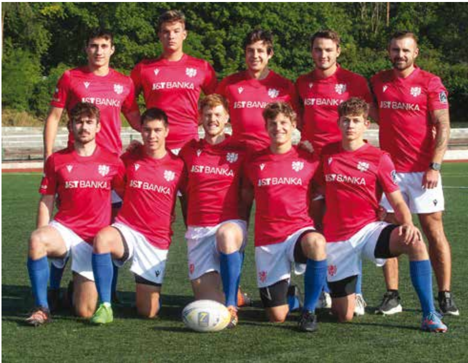
Společné foto před odjezdem na šampionát

Elitní kategorie mužského sedmičkového ragby bude v příští sezoně bez českého zastoupení. Tým podporovaný armádním klubem Dukla obsadil ve druhém díle mistrovství Evropy v Hamburku poslední 12. příčku, a neodvrátil tak hrozbu sestupu. Z Championship tak po dvou letech míří do nižší divize Trophy.