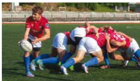
Při tréninku na Julisce

Třeba Litevci byli čtyři měsíce pospolu, jezdili po Evropě, hráli turnaje, získávali zkušenosti. My jsme se začali připravovat, až když skončily patnáctky. Měli jsme na to ani ne čtyři týdny a byli na jediném přípravném turnaji. To je