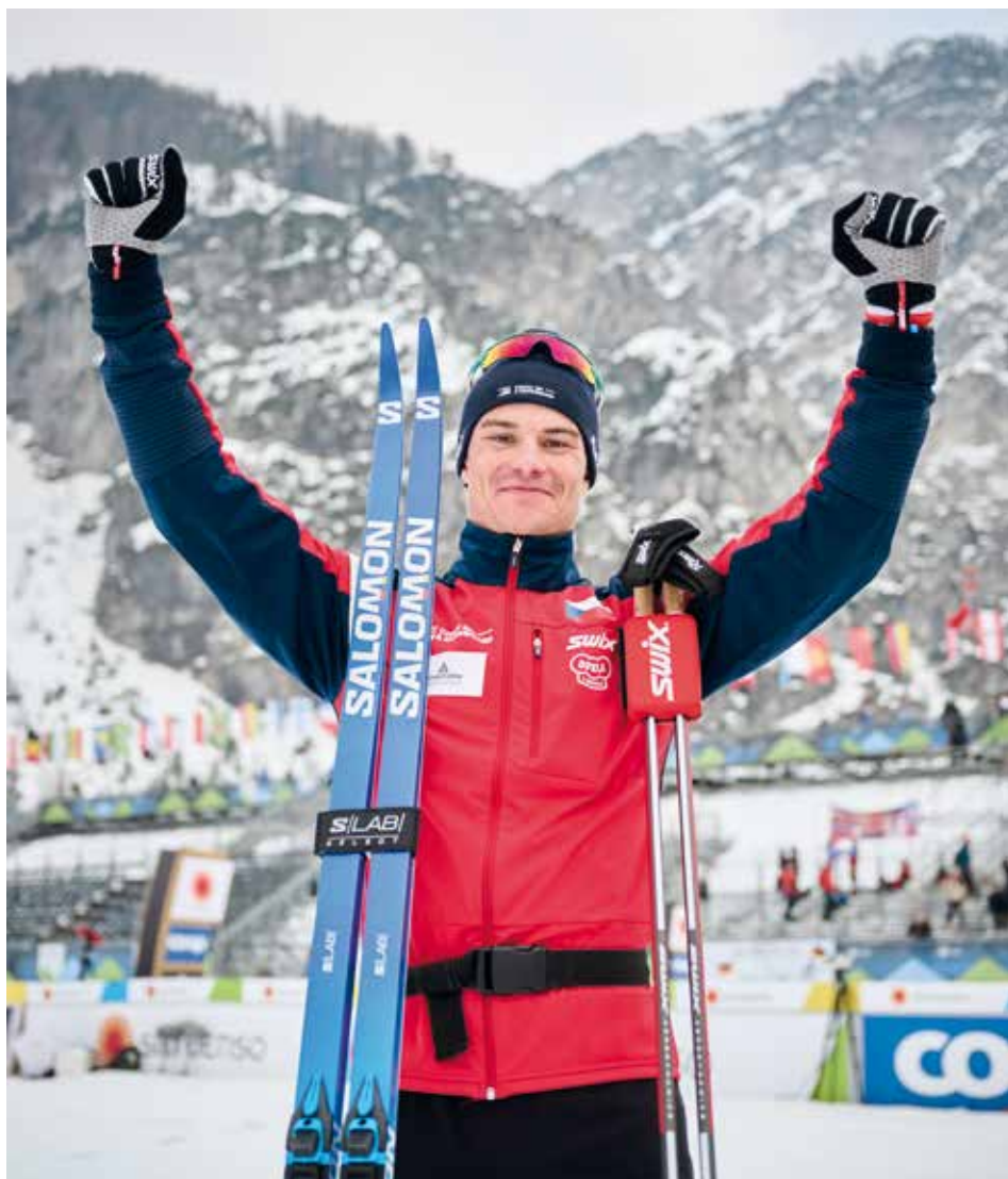
Důvod k radosti byl opravdu veliký.

Byl jsem v hlavě nastavený, že budu aktivní. Jezdíl jsem vpředu, což se vyplatilo. Vyhnul jsem se pádům a dalším nepříjemným situacím, kde hrozilo přišlápnutí lyže či zlomení hůlky.