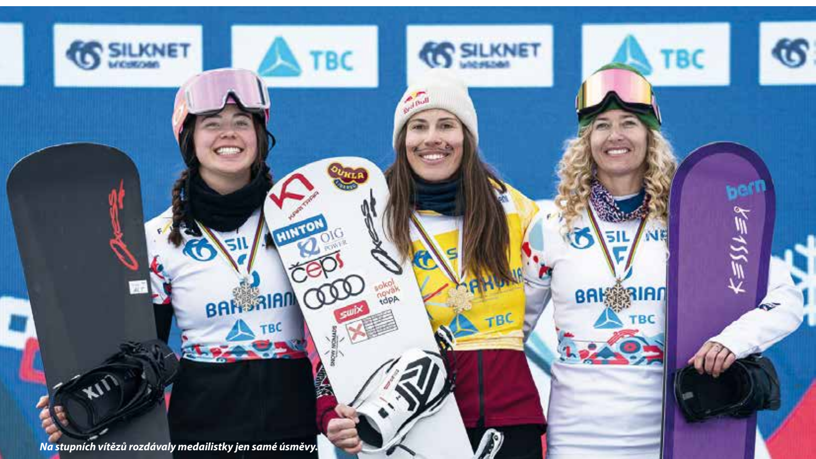
Na stupních vítězů rozdávaly medailistky jen samé úsměvy.

Takový příběh by asi těžko mohl někdo vymyslet. Napsal ho však jeden z nejlepších autorů – život.