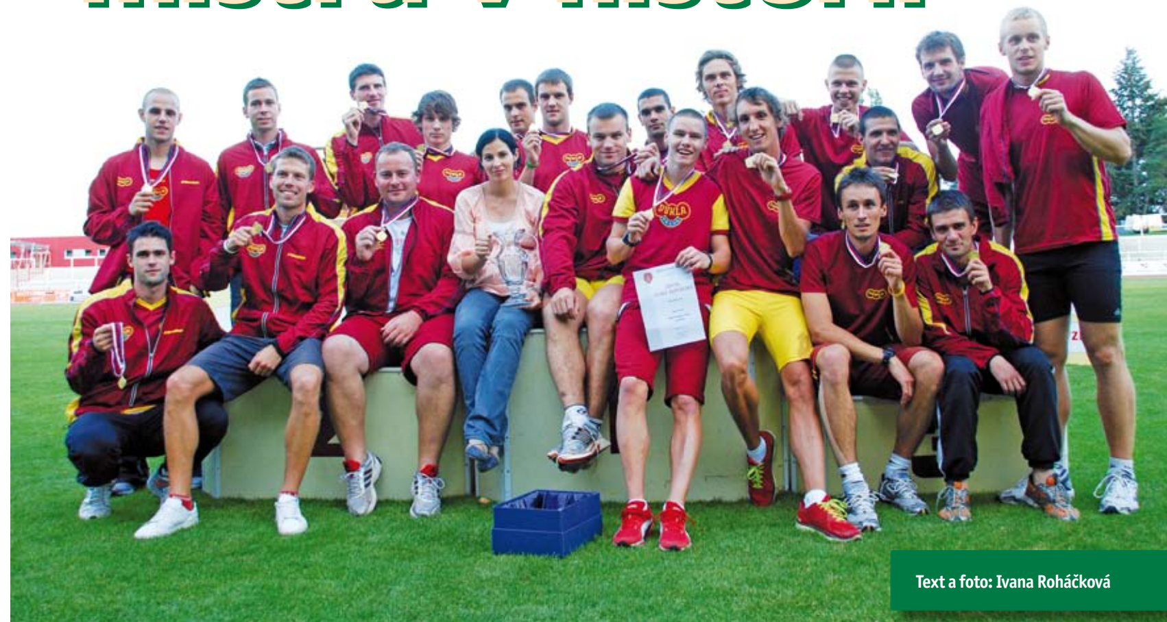
Text a foto: Ivana Roháčková

V sobotu 17. září 2011 pořádal historicky nejúspěšnější atletický oddíl Dukla Praha mistrovství republiky družstev. Atleti Dukly Praha po třech druhých místech šampionát vyhráli. Na domácí Julisce ukončili kralování AK Kroměříž z předchozích tří let, a to nejtěsnějším možným způsobem. Oba kluby měly na kontě 115 bodů, domácí celek ale vybojoval o jedno vítězství více (8:7) a získal 51. titul v historii.