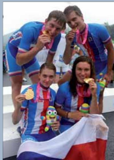
Zlatá štafeta na OHM

Text: Ivana Roháčková