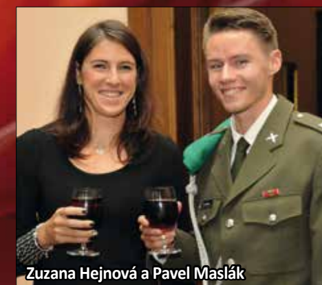
Zuzana Hejnová a Pavel Maslák